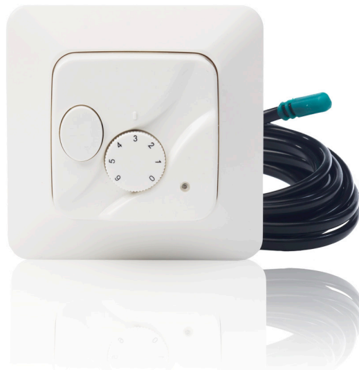
ABB Oy Asennustuotteet PL 16 (Porvoon Sisäkehä 2) 06101 Porvoo Puh. 010 22 11 etunimi.sukunimi@fi.abb.com http://www.abb.fi/asennustuotteet