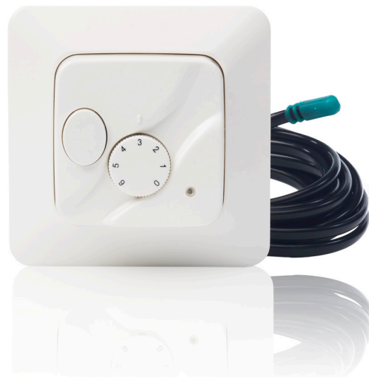
ABB Oy AsennustuotteetPL 16 (Porvoon Sisäkehä 2) 06101 Porvoo Puh. 010 22 11 etunimi.sukunimi@fi.abb.com http://www.abb.fi/asennustuotteet